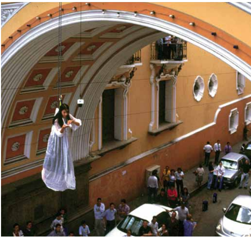
Lo voy a gritar al viento. 1999