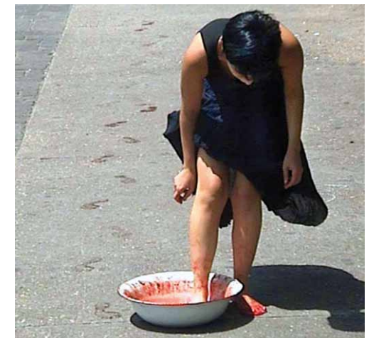
¿Quién puede borrar las huellas? 2003

Aquí se encuadra también la performance que la artista realiza bajo el título homónimo Piel de gallina , en el que permanecerá durante toda la inauguración en el interior de un refrigerador mortuorio, y los espectadores podrán abrir la cámara en cualquier momento y contemplar el proceso de transformación de su piel provocado por el frío. Esta acción será grabada y posteriormente mostrada en la exposición.